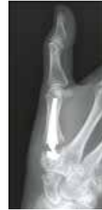
De prothese is duidelijk zichtbaar op het radiologisch beeld.

X Vaak is de beste optie het gewricht wegnemen en vervangen door een duimbasisprothese . Er zijn wel een aantal voorwaarden: er wordt nadien alleen fijn werk van de handen verwacht, het bot moet stevig genoeg zijn en de omliggende gewrichten moeten goed gezond zijn. In dat geval kunnen we onder lokale of algemene verdoving een prothese plaatsen. Dit gebeurt tijdens een korte opname in het ziekenhuis.