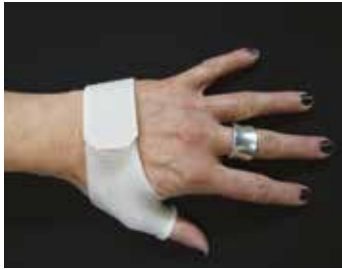
een duimpalk of 'vlinderspalk'