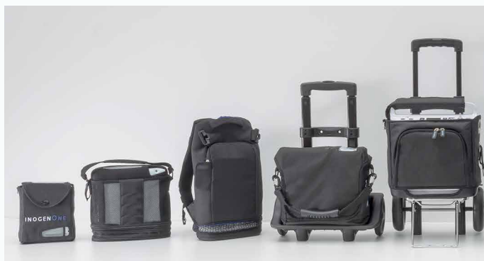
Draagbare zuurstofconcentrators.