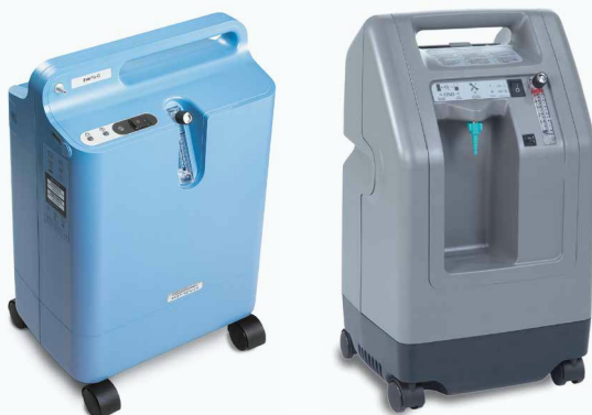
Vaste zuurstofconcentrators.