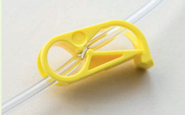
De leiding wordt afgesloten door de klem.