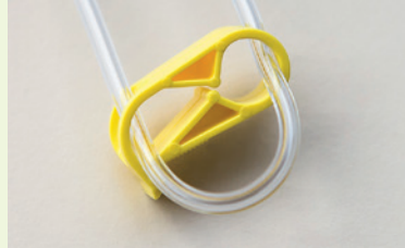
De leiding wordt niet afgesloten door de klem.