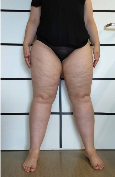
Persoon met opstapeling van vetweefsel ter hoogte van bovenbenen en onderbenen.